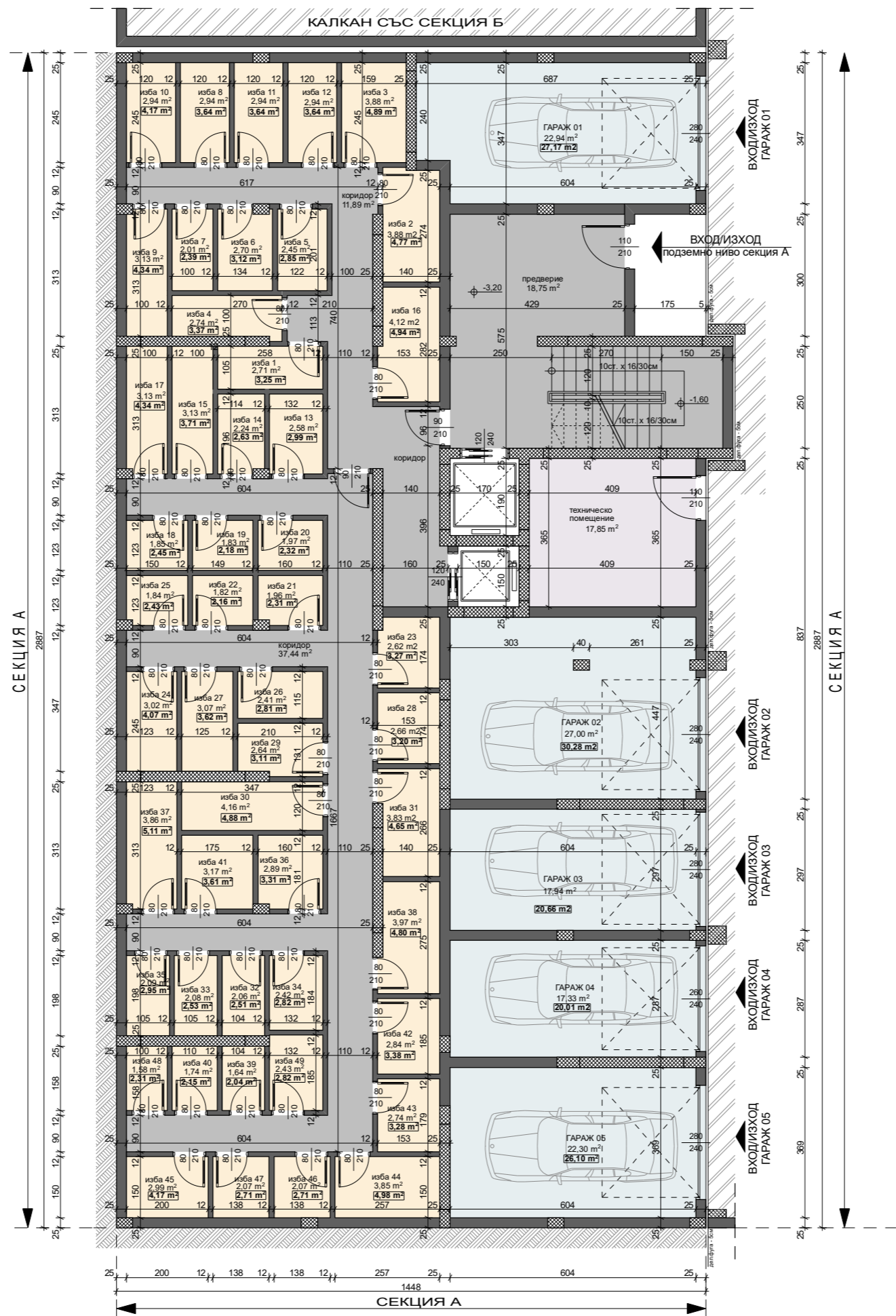
СХЕМА НА ОБЕКТА