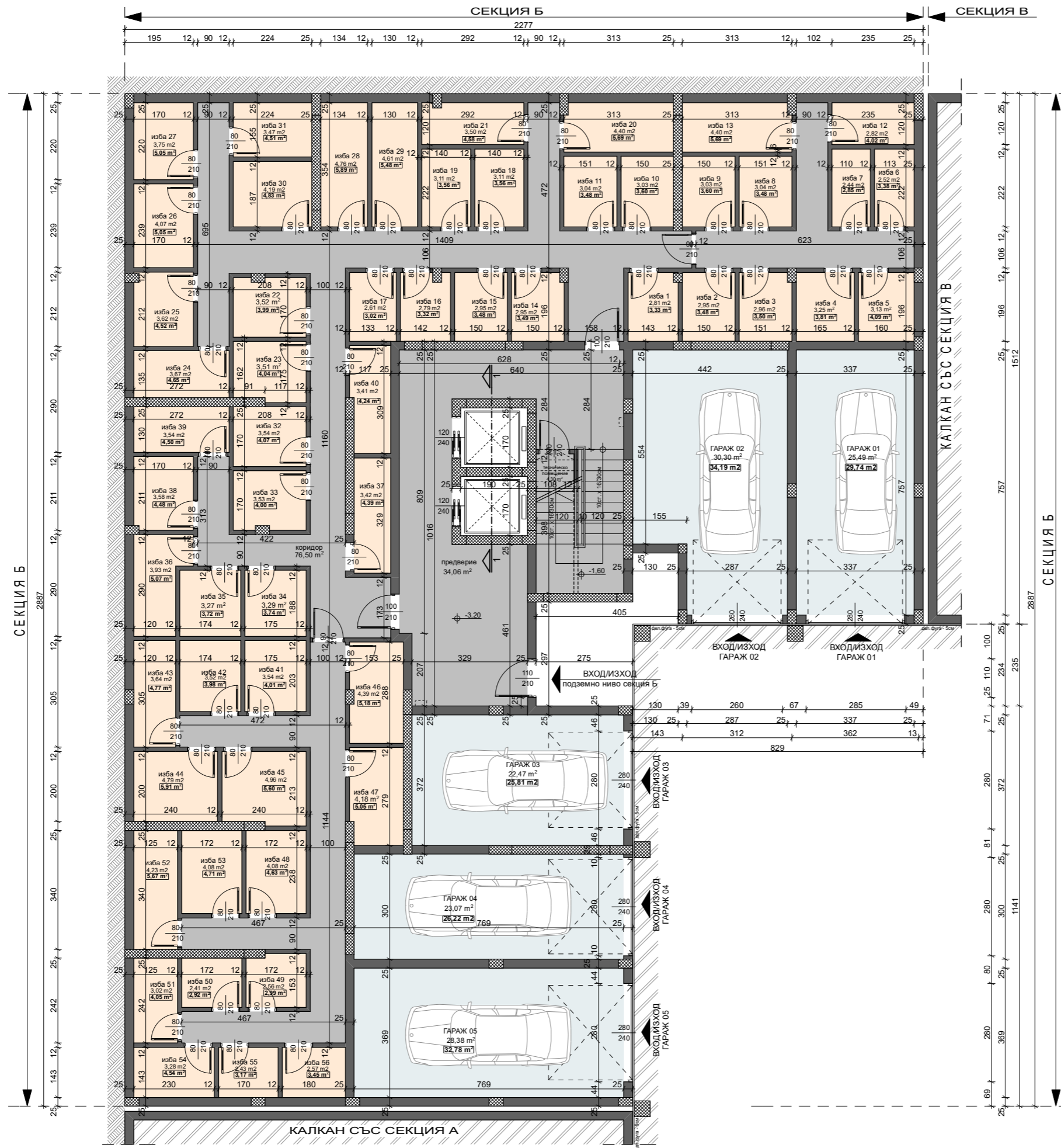
СХЕМА НА ОБЕКТА