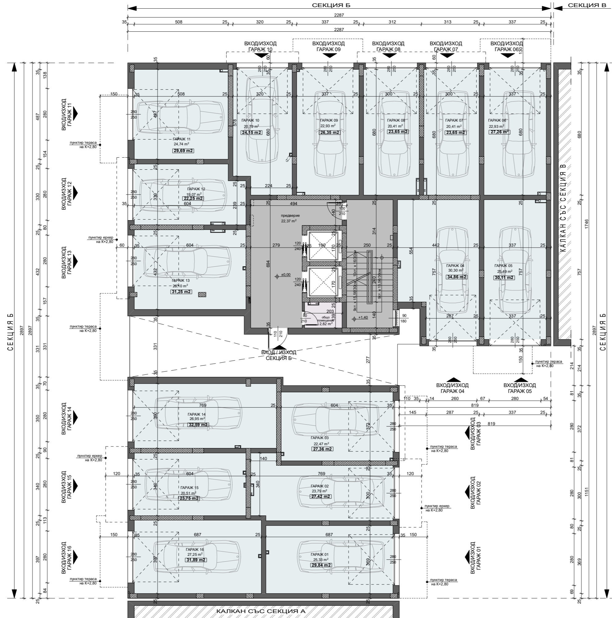
СХЕМА НА ОБЕКТА