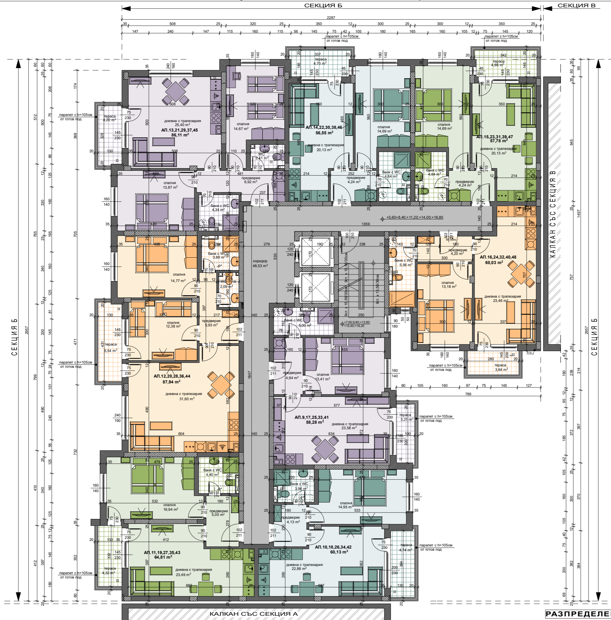
СХЕМА НА ОБЕКТА