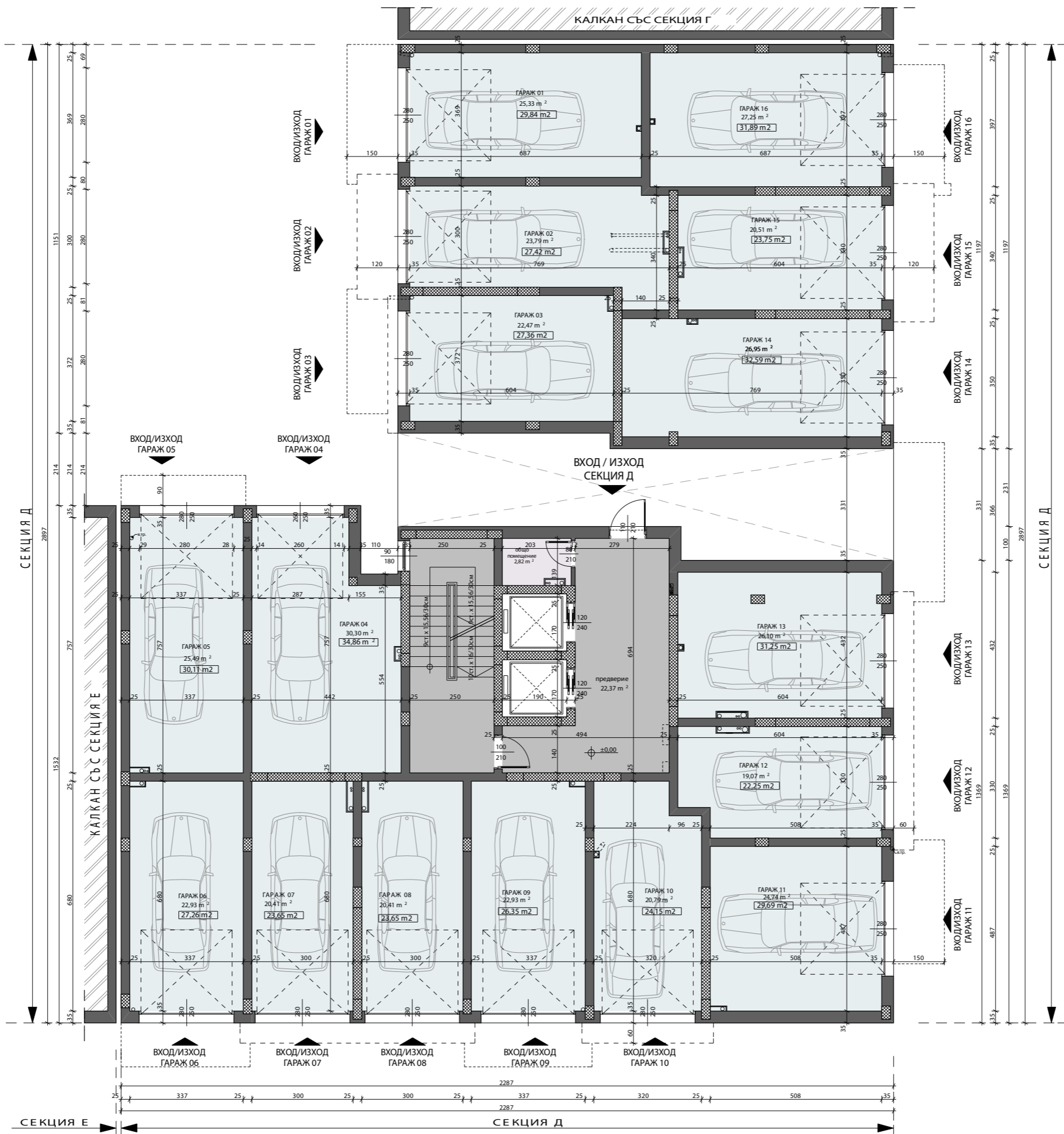
СХЕМА НА ОБЕКТА