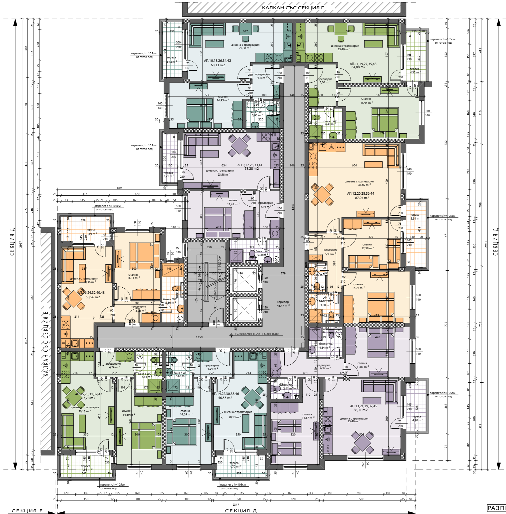
СХЕМА НА ОБЕКТА