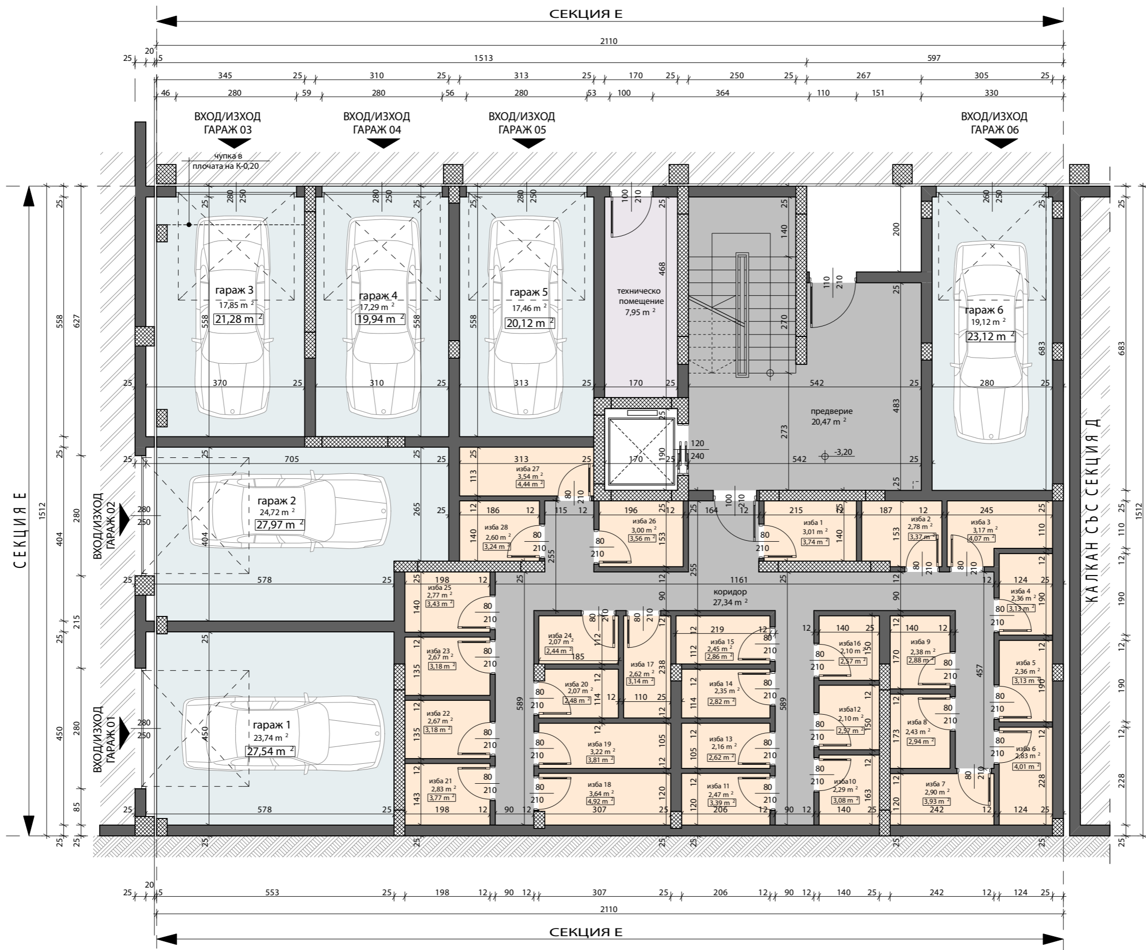
СХЕМА НА ОБЕКТА