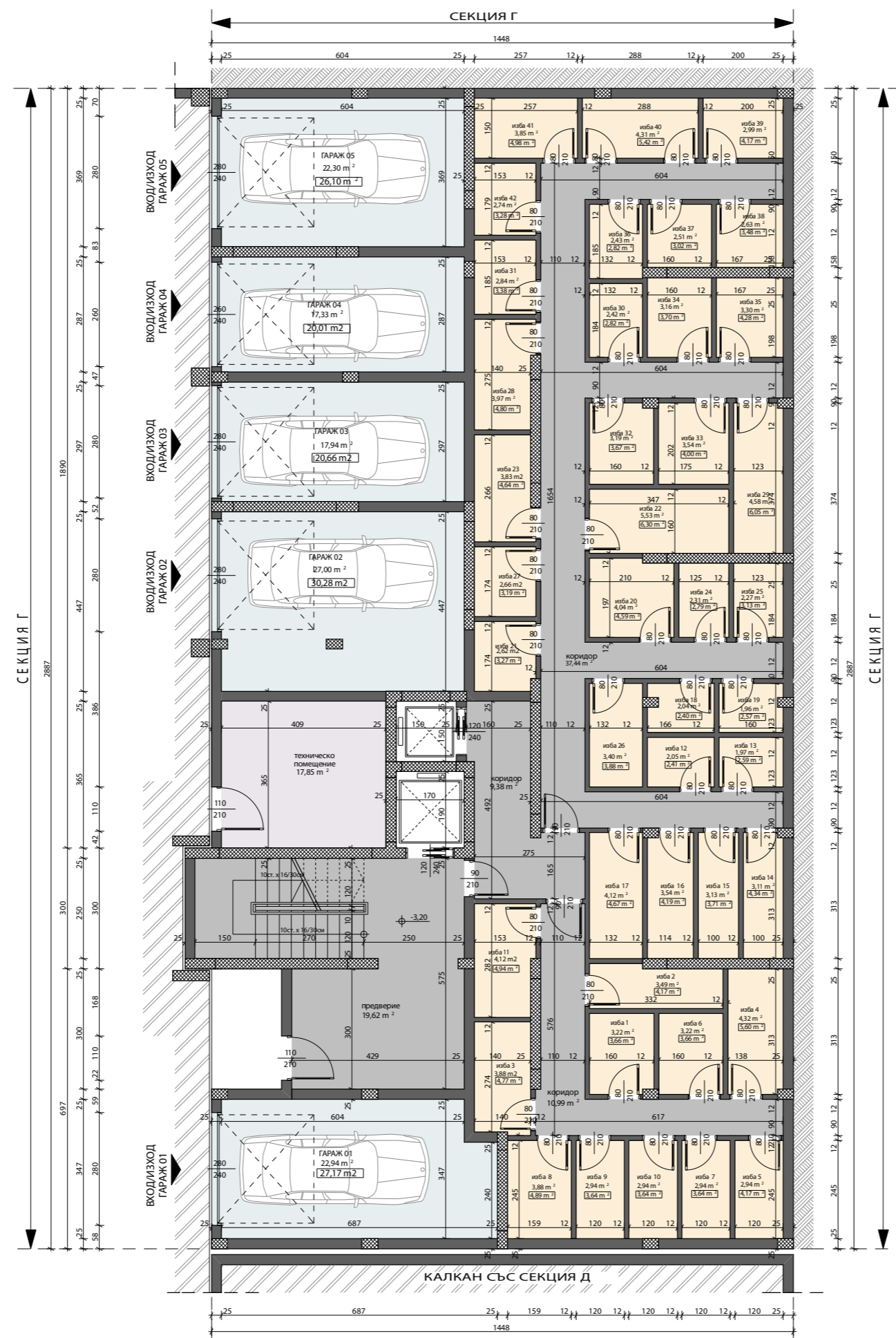
СХЕМА НА ОБЕКТА