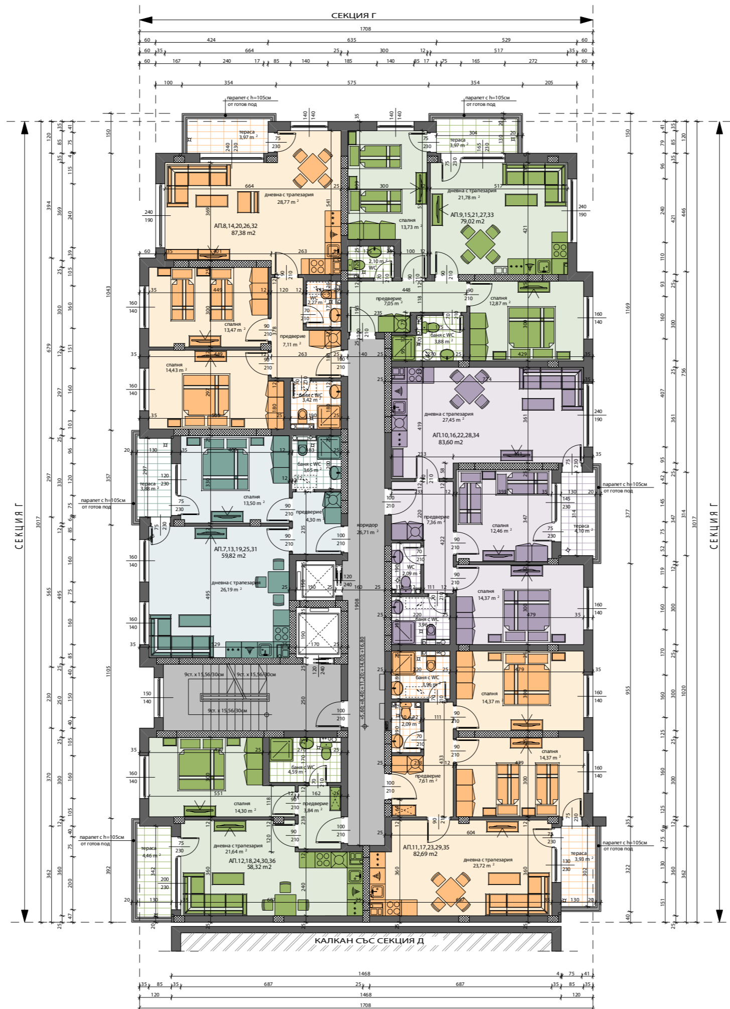
СХЕМА НА ОБЕКТА