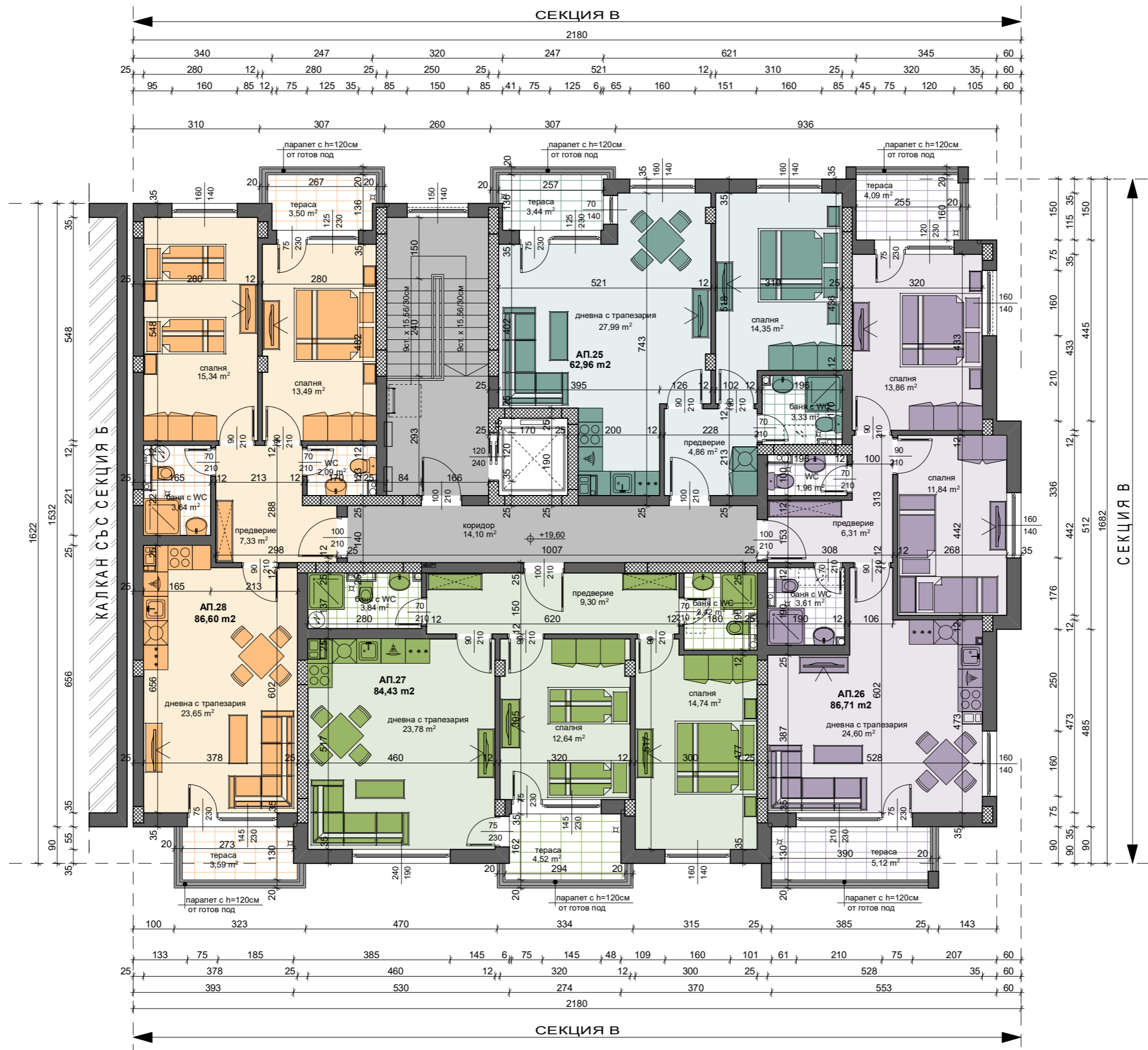
СХЕМА НА ОБЕКТА